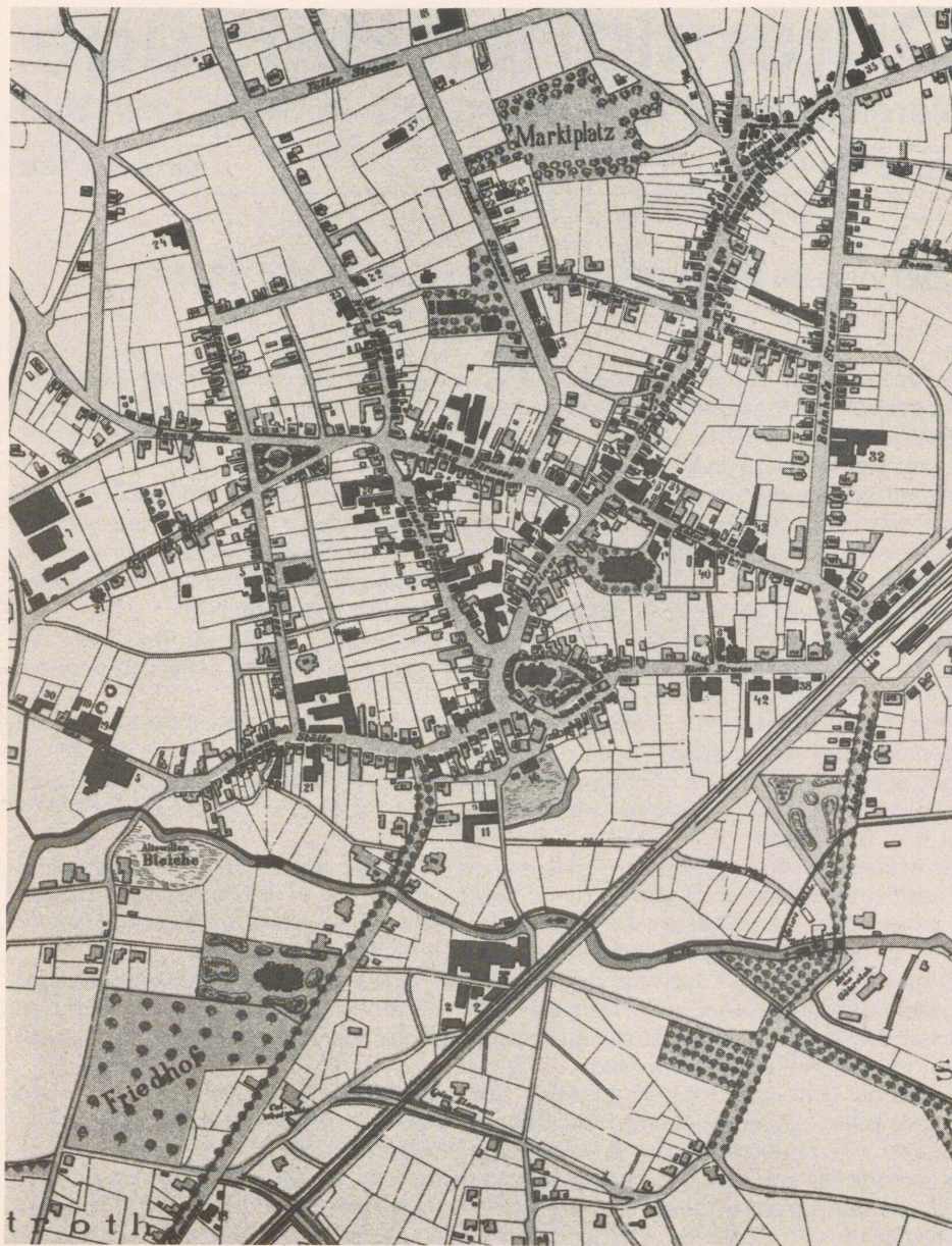
Diese Abbildung zeigt – wie auch auf der Titelseite – einen Ausschnitt aus dem Stadtplan von 1893