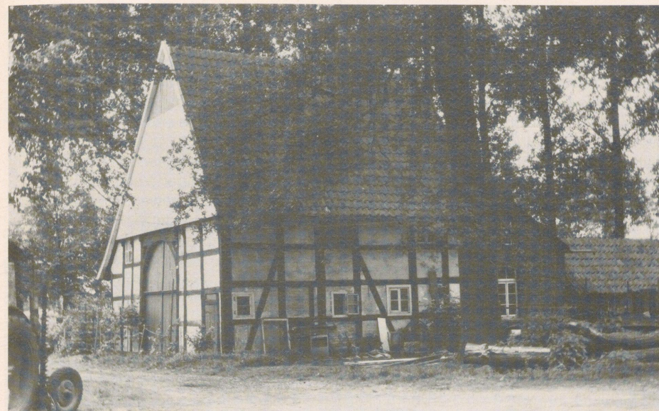
Hier zwei der mit dem 3. Preis ausgezeichneten Aufnahmen der von Monika Füller geleiteten Foto-Arbeitsgemeinschaft der 4. Klasse der Edith-Stein-Grundschule :

Oben das 1750 erbaute Heuerlingshaus am Lutterweg, unten die Hinteransicht eines 1572 erbauten kleinen Bauernhauses am Amtenbrinksweg