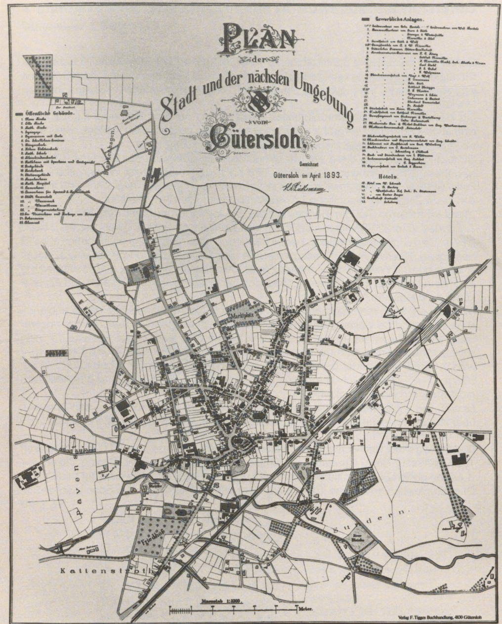
Hier eine verkleinerte Abbildung des gesamten Stadtplans