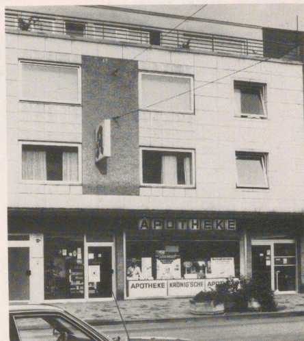
Zwei Jahrhunderte liegen zwischen diesen Baustilen: Oben links die vielen älteren Güterslohern noch vertraute alte Krönig'sche Apotheke in der Münsterstraße, rechts der Neubau an der Berliner Straße. Auf der rechten Seite ein Ausschnitt aus dem Hüsseten-(= Einwohner-) Register von 1738 mit Hinweis auf die Familie Diekhoff.