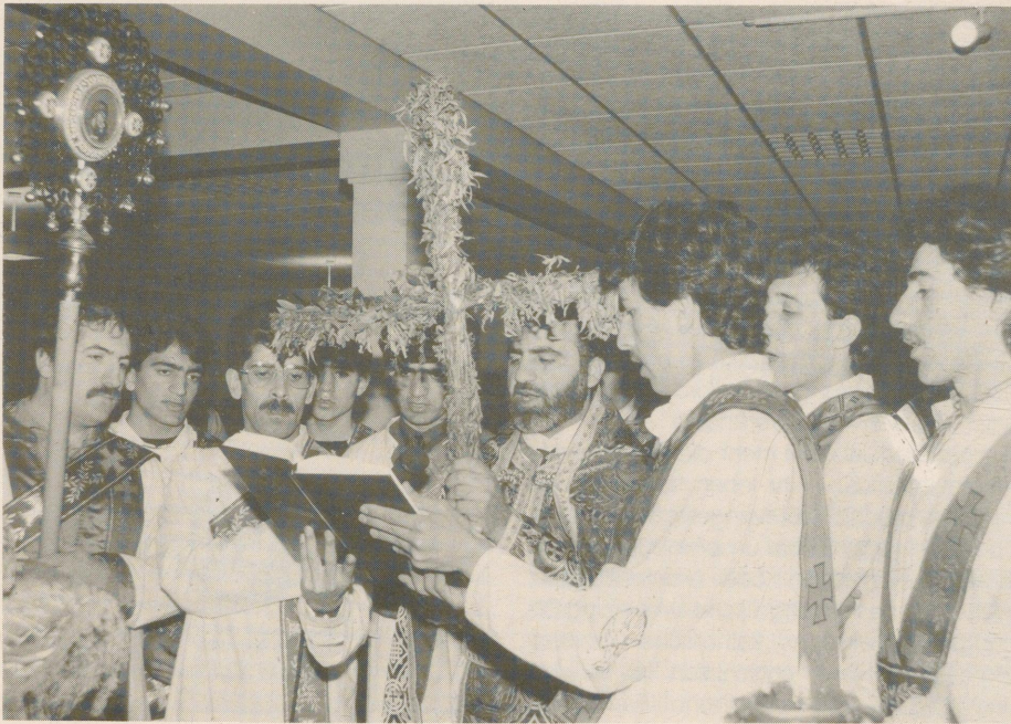
Syrisch-orthodoxer Gottesdienst der Aramäer am Palmsonntag 1989 in Gütersloh.

Gewiß: die normative Kraft des Faktischen wird auch hier ihre Wirkung tun. Man muß ja – ob man es will oder nicht – miteinander umgehen, aufeinander Rücksicht nehmen, einander zu verstehen lernen. Die Vorurteile aber sind groß, die Sprachbarrieren nur ganz allmählich zu überwinden. Fundamental differierende Glaubens- und Lebensformen kommen erschwerend hinzu. Die in solchen Gegebenheiten verborgene Sprengkraft sollte man nicht unterschätzen.