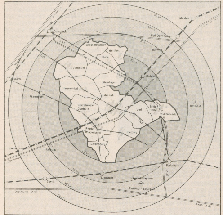
Als Kreisstadt hat Gütersloh seit 17 Jahren auch eine zentral-örtliche Bedeutung.

Unsere Stadt ist wohlhabend. Ihr Kämmerer kann Jahr für Jahr über eine „freie Spitze“ von etwa acht Millionen DM verfügen, genauer: verfügen lassen. Daß dem so ist, verdanken wir unserer ebenso breitgestreuten