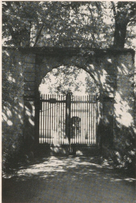
Das Schloßtor in der Umwallung, im Torbogen rechts oben die Zahl 1616