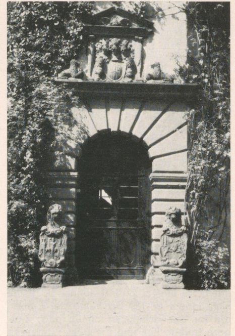
Das Portal im Mittelturn mit verschiedenen Löwengestalten