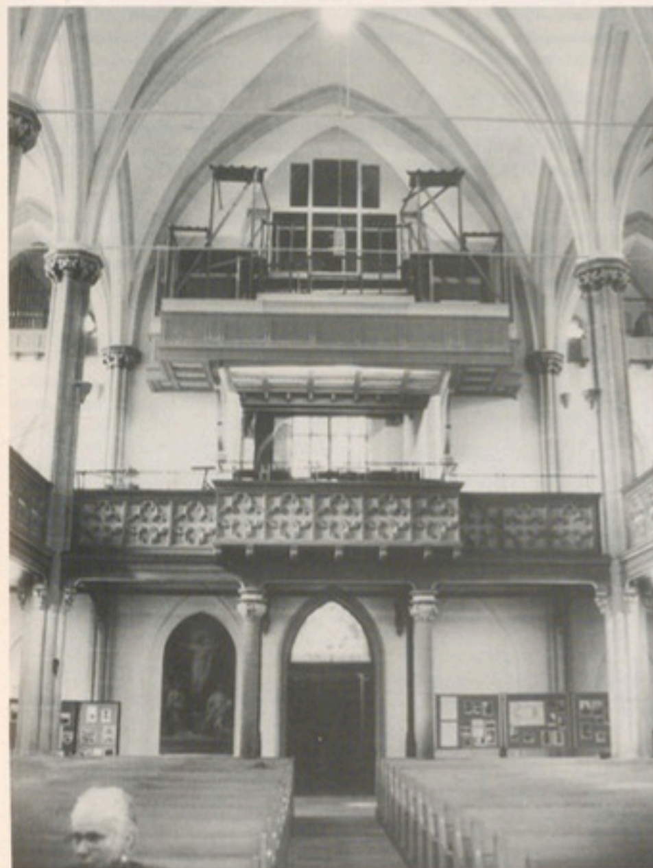
„Pflegerfall“ Martin-Luther-Kirche: Renovierungsarbeiten brachten massive Schäden in der Bausubstanz ans Licht. Jetzt setzt die Kirchengemeinde auf Spenden.