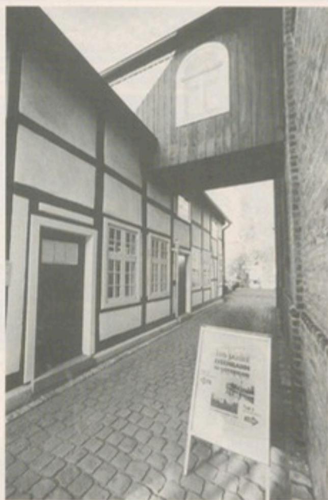
Rundgang perfekt: Beide Museumsteile sind durch eine Brücke verbunden.

Die umfangreiche Liste der an der Planung, Finanzierung und Gestaltung beteiligten Personen und Institutionen mag vielleicht nicht vollständig sein - dieser Mangel soll jedoch niemanden, der oder die vielleicht unerwähnt geblieben ist, um Dank und Anerkennung bringen. Genannte und Ungenannte sollen sich einbezogen fühlen in die Gemeinschaft derer, die bür-