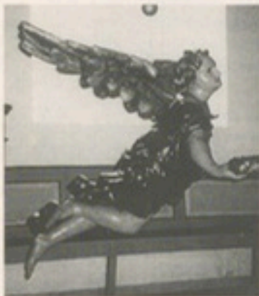
Abb. 8: Taufengel schwebend

Von diesem Erfahren gottgewollten Schutzes in Engelnsgestalt sprechen auch einige Kirchenlieder (56). So ist es nicht verwunderlich, daß die Schaffung von angelomorphem liturgischem Gerät „die bedeutendste Leistung der protestantischen Engel-Ikonographie ist, in deren