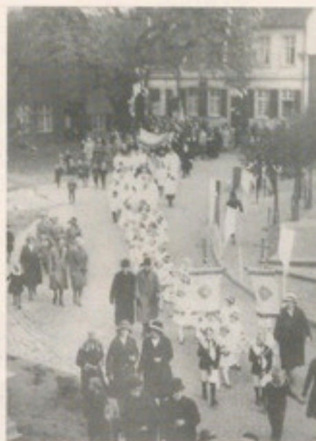
Gegenfest: Fronleichnamprozession in Harsewinkel um 1935.