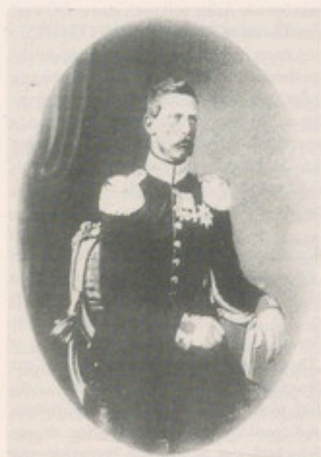
Abb. 5: Prinz Friedrich Wilhelm (um 1856)