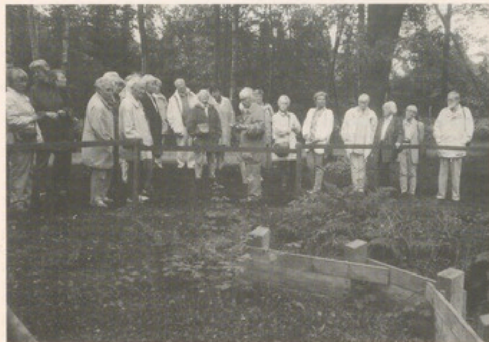
Erkundungen in nördlicher Landschaft: die Reisegruppe des Heimatvereins besichtigt eine Torfschiff-Schleuse im Teufelsmoor.