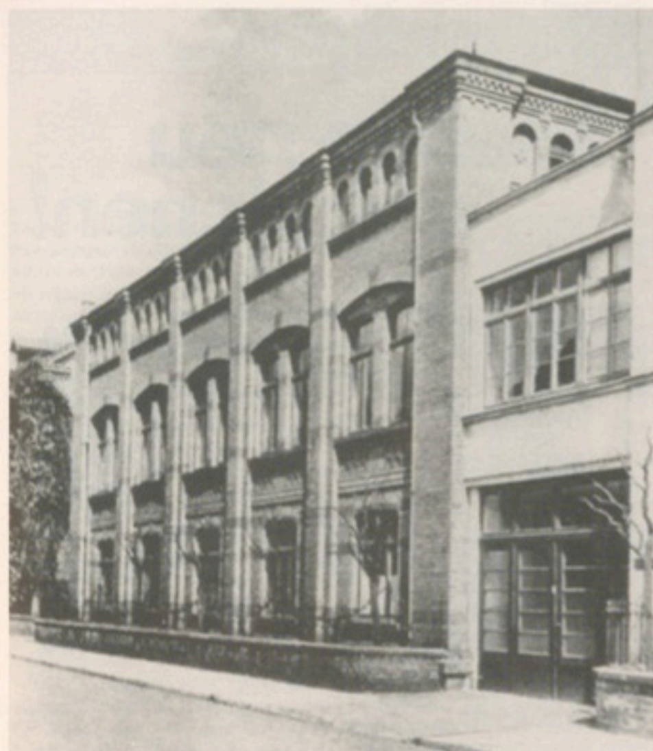
Stammbaus der Medienindustrie: das Druckereigebäude der Firma Bertelsmann in der Eickhoffstraße

Die Gründung zahlreicher kleinerer und größerer Industriebetriebe, das Anwachsen der handwerklichen Grundlage auf den doppelten Umfang und das schnelle Ansteigen der Zahl der Industriearbeiter, die 1910 fast ein Sechstel der etwa 7.500 Einwohner zählenden Gesamtbevölkerung ausmachte, kennzeichnen zusammenfas-