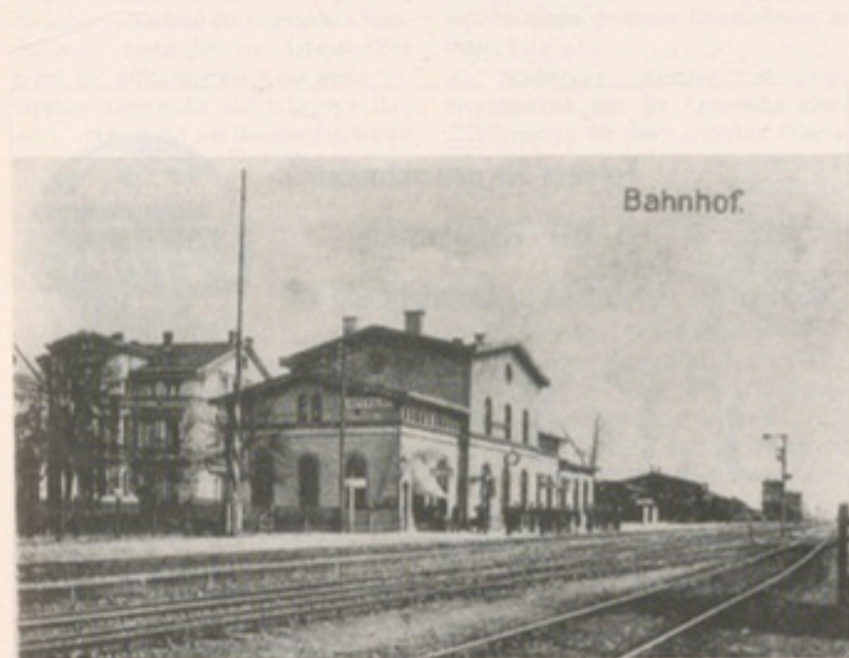
Aspekte Gütersloher Industriegeschichte: Der Bahnhof im Jahr 1899

Daß Gütersloh trotzdem eher spät begann, eine florierende Wirtschaftsstruktur zu entwickeln, mag auch daran gelegen haben, daß erst im Jahre 1910 die Aufteilung in Stadt- und Landgemeinde aufgehoben wurde. Erst jetzt konnte sich die Stadt