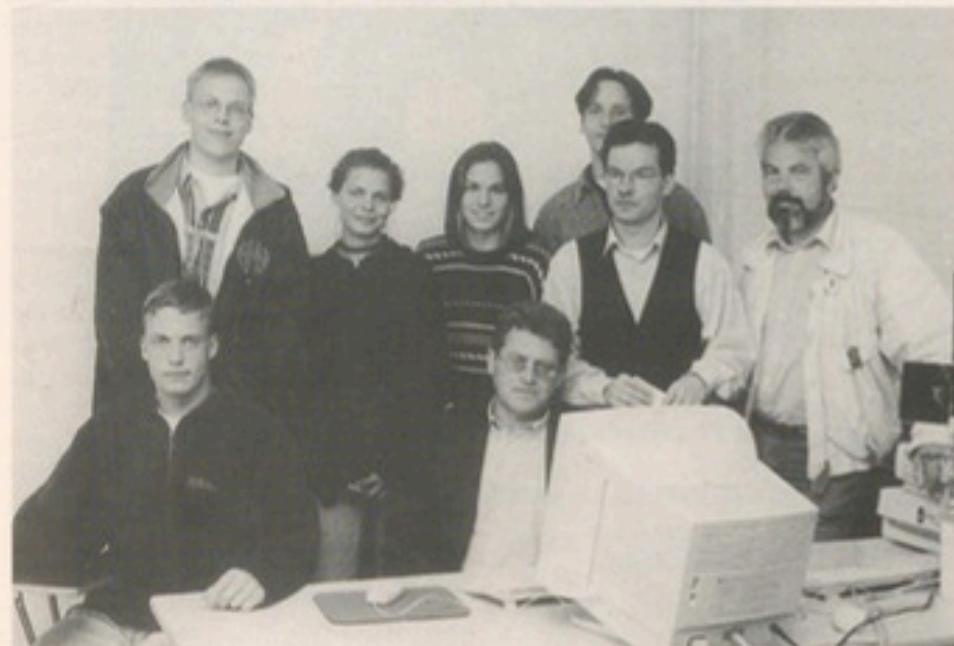
Mit Gütersloher Geschichte im Internet: Leistungskurs des städtischen Gymnasiums Gütersloh mit den Lehrern, die das Projekt betreuen.

Unsere heutige Wirklichkeit ist durch die Industrialisierung und Urbanisierung des 19. und 20. Jahrhunderts im wesentlichen bestimmt. Sie prägt nicht nur unser eigenes Selbstverständnis, sondern auch die Sichtweise auf das historische Erbe. Die Industrialisierung im 19. Jahrhundert bildet offensichtlich eine tiefe Zäsur in der Menschheitsgeschichte. Um die vielfältigen Ursachen, Bedingungen und Folgen des paradigmatischen Umwälzungsprozesses im Ansatz zu verstehen, ist es notwendig, nicht mehr nur politikgeschichtliche Dimensionen in den Blick zu nehmen,