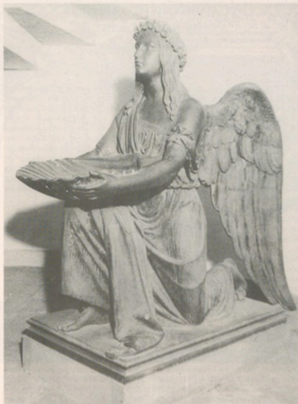
Nach vier Jahrzehnten unter der Treppe der Martin-Luther-Kirche wiederentdeckt und in den Kirchenraum zurückgeholt: Taufengel von Thorvaldsen

genden - auch im Sinne von Spurensuche und -sicherung - versucht werden.