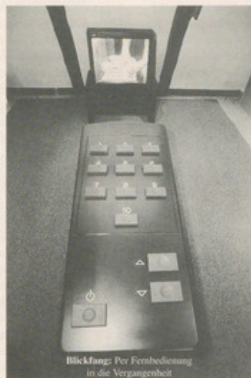
Blickfang: Per Fernbedienung in die Vergangenheit

Überdimensionale Fotos führen beklemmend vor Augen, was schriftlich seit langem dokumentiert ist: Nicht unbemerkt hat sich dieser Frevel vollzogen, die Schaulustigen standen im Pulk vor der Apostelkirche, auch in Gütersloh hat man „gewußt“. Ist dies nur eine Station in der Stadtgeschichte? Hier gilt es, durch Sonderausstellungen die Hinweise zu verstärken - jene zur Zwangsarbeit während des Krieges in Gütersloh ist vor kurzem zutage gekommen, eine über „Feste im Nationalsozialismus“ wird Anfang 1998 folgen. Der Blick auf dieses schändliche Kapitel jüngerer Vergangenheit eröffnet spätestens