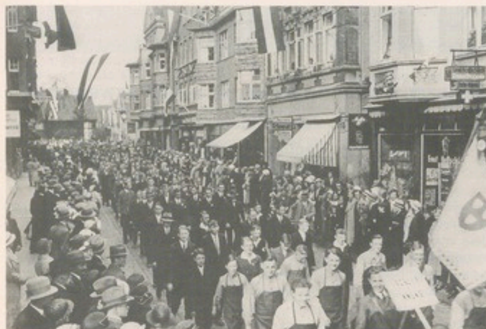
Teilnehmer der Tischlerinnung beim Umzug am 1. Mai 1933 in der Berliner Straße. Ab 15. Februar 1998 ist die Ausstellung „Das Dritte Reich im Fest“ im Gütersloher Stadtmuseum zu sehen (s. auch „Rezension“).