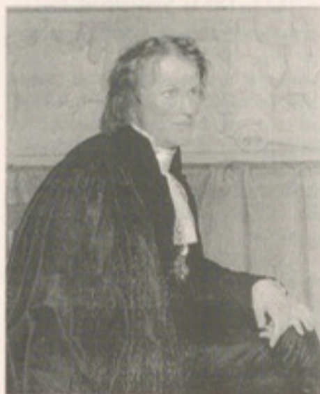
Abb. 6: Der dänische Künstler Bertel Thorvaldsen

Vor diesem Hintergrund sollten wir Thorvaldsens Wiederentdeckung in Deutschland sehen. Sie wurde eingeleitet durch die große Kölner Ausstellung von 1977, zu der Eduard Beaucamp in einer Bespre-