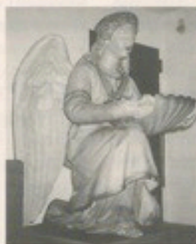
Abb. 7: Engel in Bethel

Uns Heutige vermag das von Thorvaldsen in der Kopenhagener Frauenkirche geschaffene Ensemble kirchlicher Kunst - ganz abgesehen von seiner Bedeutung für die Sakralskulptur des 19. Jahrhunderts - durchaus in seiner intendierten theologischen Aussage anzusprechen, vorausgesetzt, man übt sich in der Haltung, die Fontane in dem dieser Arbeit vorangestellten Zitat empfiehlt. Denn in der Zuordnung von Christus - Altartisch - Taufengel,