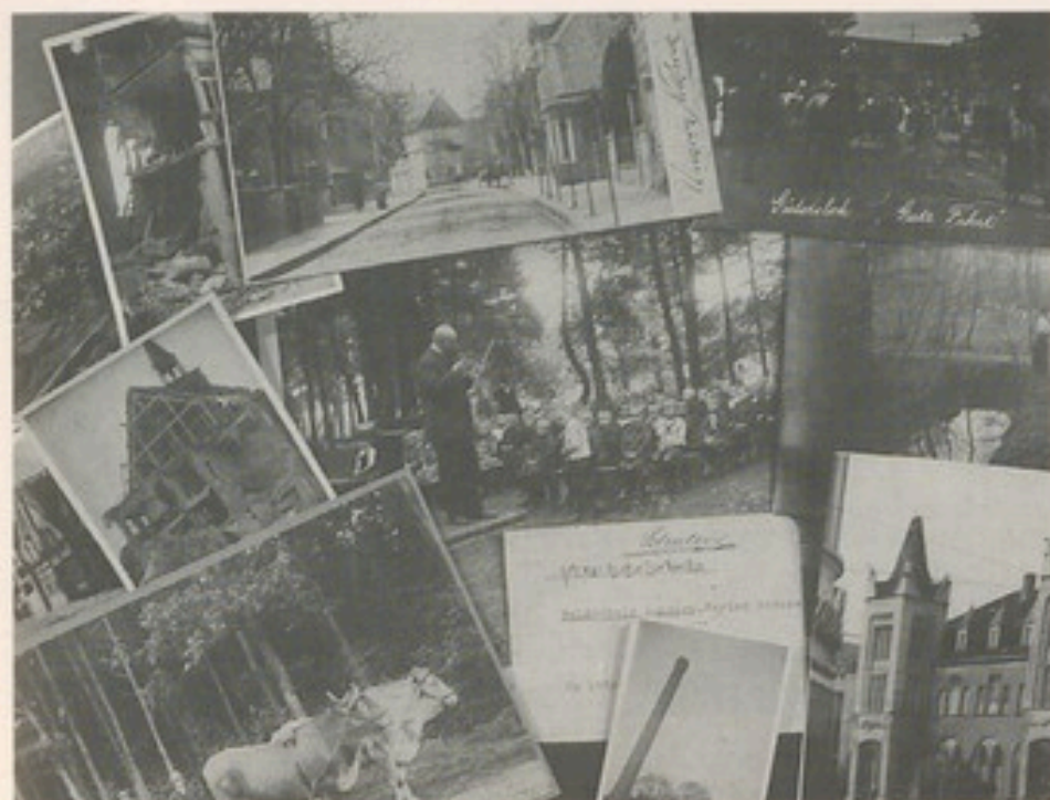
125 Jahre Gütersloh durch das Auge der Kamera: die Fotosammlung im Stadtarchiv

Wie bereits eingangs erwähnt, wird die weitere Ergänzung der archivischen Fotosammlung angestrebt, um die Entwicklung und die Geschichte der Stadt ab Mitte des 19. Jahrhunderts möglichst lückenlos dokumentieren zu können. Dabei ist eine großzügige Beteiligung von privater Seite unverzichtbar. Auf diese Weise können Arbeiten zu stadthistorischen Themen an Schulen und Universitäten unterstützt, Veröffentlichungen zur Stadtgeschichte,