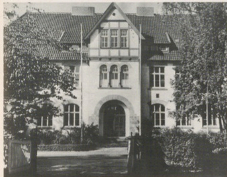
Schuljubiläum: Die Overbergschule an der Neuenkirchener Straße feierte im September 100jähriges Bestehen.

28. Für die geplante Gesamtschule auf dem Gelände der Hauptschule Süd begannen die Bauarbeiten.