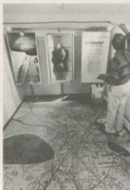
Geschichte begreifbar: Obergeschoß Fachwerkhaus

Per Knopfdruck in die Vergangenheit? - Die Fernbedienung, entscheidendes Requisite der deutschen Sofaecke prägt sich unerschütterlich ins Gedächtnis ein: Überdimensional und mächtig regiert sie einen ansonsten schlichten Raumwinkel im soeben eröffneten zweiten Teil des Stadtmuseums, in dem lediglich eine Flötoto-Schrankwand den Bezug zu Gütersloher Geschichte herstellt. Natürlich wird sie zum Jonglieren mit den dicken Gummitasten verführen, nicht nur Kindergruppen werden von solch hohem Maß an Wiedererkennungseffekt angezogen - und schwupp zappt sich's zügig durch Schmalfilme und Videos aus der Stadthistorie - häppchenweise, wenn's beliebt. Den