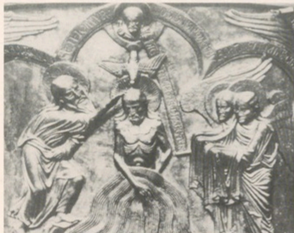
Abb. 9: Christus mit Engeln (romansisch)

Die Muschel - von Thorvaldsen zunächst als Schale entworfen - war „als Zeichen für Gottes Weisheit und für die Klarheit des heiligen Geistes, der in der Taufe empfangen werden soll, allgemein verständ-