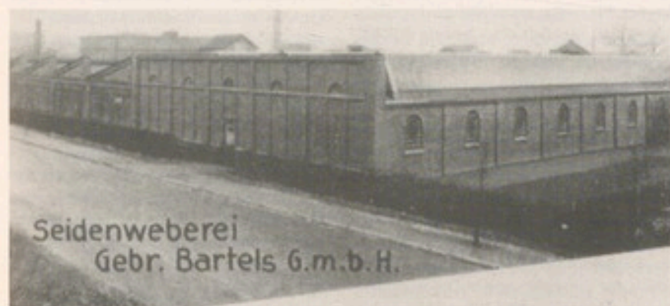
Industrie auf Postkarte: die Seidenweberei Gebr. Bartels, Aufnahme aus dem Jahr 1934

Interessanterweise blieb der sich anderswo regende Widerstand in Gütersloh eher gering, ein Proletariat mit entsprechendem Streikpotential gab es, ähnlich wie in Rheda, eigentlich nicht. Offenbar förderte die ländliche Eingebundenheit und die Perspektive, nicht immer lebenslang in der Fabrik arbeiten zu müssen, diese Haltung. Obwohl die Arbeitszeit täglich etwa zwölf Stunden betrug und alle Wochentage umfaßte, die Produktion nur an den Sonn- und Feiertagen ruhte und es keinen Urlaub gab, wurden die Probleme im Industriedorf Gütersloh durch überwiegend intakte Familienstrukturen aufgefangen. Darüber hinaus milderte die Verbindung zwischen dem relativ späten Übergang zur Fabrikarbeit in Gütersloh und der im Vergleich recht frühen Einrichtung von Sozialeinrichtungen die mit der Industrialisie-