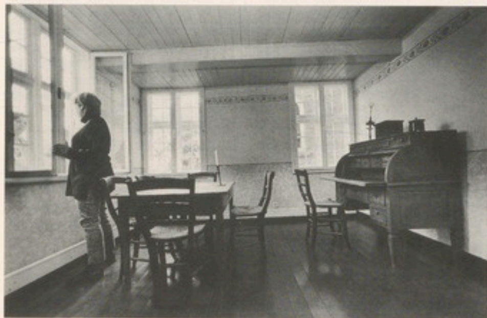
Nicht im Original, aber im Stil der Zeit: biedermeierliche Einrichtung in Buschmanns ehemaligem „Lehrer-Zimmer“.

Wenn dazu eine Riesen-Fernbedienung Mittel zum Zweck ist: Warum nicht? - Berieselt wird im Gütersloher Stadtmuseum jedenfalls niemand.