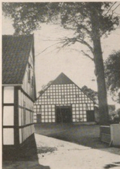
Der Hof Kreft im „Golddorf“ Oesterweg

Ein reizvoller Kreis von der Ravensburg bis Schloß Eden