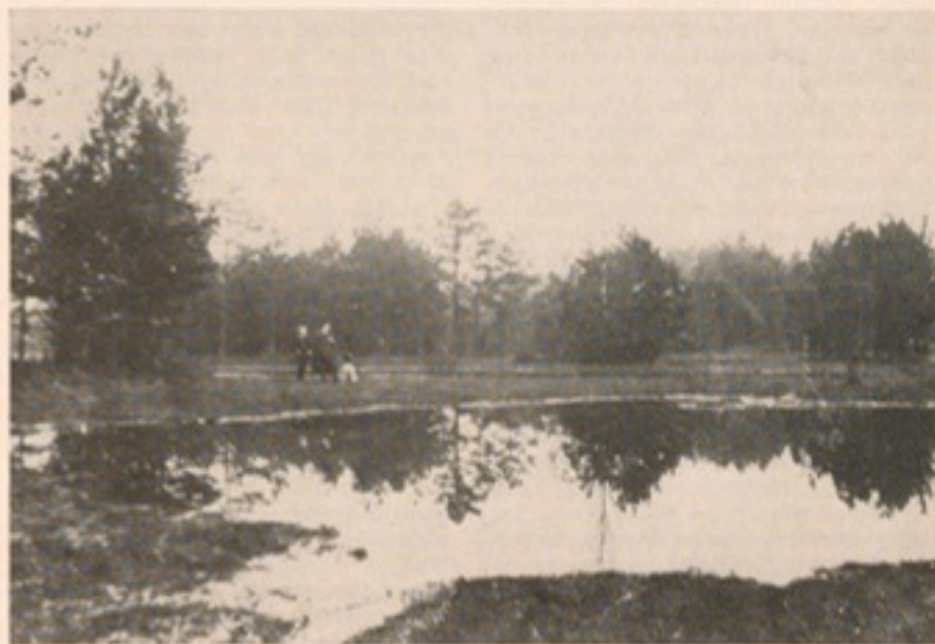
Ein Heideweiher im südlichen Ohlbrock etwa um 1904

Neben den Radtouren und häufigen Besuchen des Ohlbrocks oder anderer Naturgebiete in der Nähe kamen wir dann — wohl auch durch eine Anregung von Vikar Schwirling — auf die Idee, Vögel und kleine Säugetiere auszustopfen. Wir übten nach irgendwie beschaffter Anleitung an Eichelhähern, Elstern und Eichhörnchen,