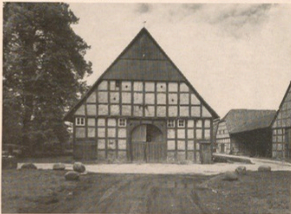
Gut Geissel: Gesamtansicht von Süden her