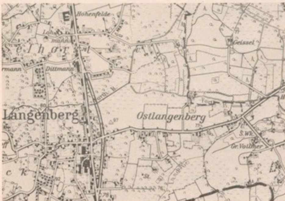
Hier liegt das Gut Geissel

Laubwald und nur bedingt ackerfähigem Boden, liegt das Anwesen in der östlichsten Randlandschaft der Beckumer Berge an der Schwelle zur flachen Emsniederung, aus der es sich inselartig erhebt. Aus dieser topographischen Situation erklärt sich zugleich der Hofname: Gestelle (= Geissel), geest, geist nämlich bedeutet „erhöht gelegenes Land“, und noch heute tragen hier Flurstücke die Bezeichnung Geist.