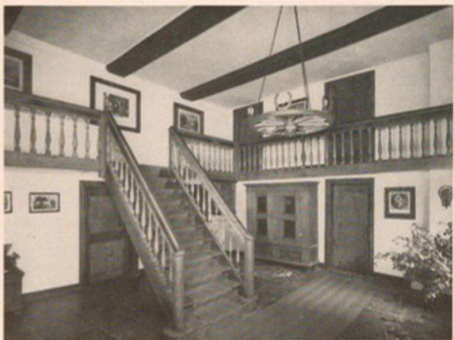
Blick in das Vestibül von Gut Geissel

Das Deelentor trägt auf seinem Sturzriegel die Inschrift BEATUS ILLE QVI PROCVL NEGOTIJS und auf seinen Kopfbändern die Erbauungszeit ANNO DNI 1748 18. Juny. Über den beiden seitlichen Stalltüren ist das Vergilzitat SIC VOS (links) NON VOBIS (rechts) zu lesen. Und folgender Spruch zielt die Giebelschwelle: „In Gottes Schutzhand wohnend ist ein sicherer Aufenthalt, Er kann's Haus vor Feuer schonen, Glück bescheren, selgen Tod“. Zwei Jahre später wurde in symmetrischer Ergänzung zur Scheune ⑦ der bis vor einiger Zeit zur Haltung von Pferden genutzte Stall ④ angelegt. Seinem Torbogen ist der Richttag DEN 30 IVNY ANNO 1750 eingeschrieben.