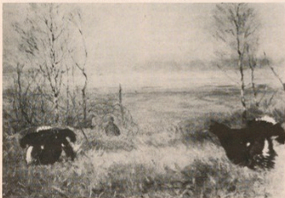
Birkhahnbalz im Ohlbrock (Gemälde von P. Westerfröke um 1910)

Nach Beginn meines Studiums in Münster (1902) konnte ich nur an Wochenenden und während der Ferien Kattenstroth und das Ohlbrock besuchen, dieses später vor allem als Jägermann. Inzwischen hatte jedoch der „Schwirling'sche Naturforscherklub“