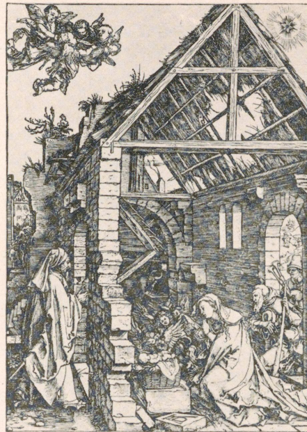
„Die Geburt Christi“ aus dem Holzschnittwerk „Das Leben Marias“ (1504/05) von Albrecht Dürer