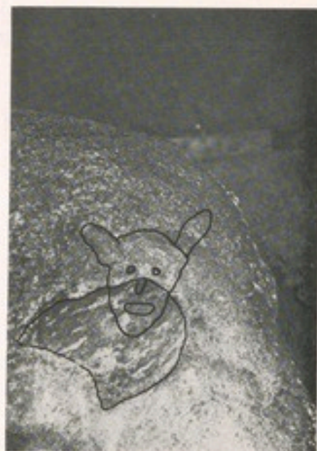
Die Zeichnung links oben zeigt den Kopf in der unteren Grotte der Externsteine (nach Hans Gsaenger); rechts darunter der Torso auf dem Findling am Alten Kirchplatz (beides nach einer Skizze von H. Roggenkamp); im Foto rechts die betreffende Stelle auf dem Findling

habt haben, Nicht-Eingeweihte abzuschrecken. Es ist jedoch nicht auszuschließen, daß sie auch eine andere Bedeutung gehabt haben. Am bekanntesten dürfte die Petrusfigur an den Externsteinen sein, die wegen des erkennbaren Schlüssels (vielleicht später eingearbeitet) als Petrus gedeutet wurde, aber mit ziemlicher Sicherheit „der Hüter der Schwelle“ war. Auch die „barocke“ Maske im Sazellum kann man als Wächter deuten, da sich der Eingang zu diesem Kultraum wahrscheinlich an der Nordseite des Felsens befand. Zu meinen eigenen Entdeckungen gehört ein „Wächter“ im Druidenhain zu Wohlmannsgesee (Ofr.) und ein diesem ähnliches Gesicht an der westlichen Schmalseite des Visbecker Bräutigams in der Nähe von Wildeshausen.