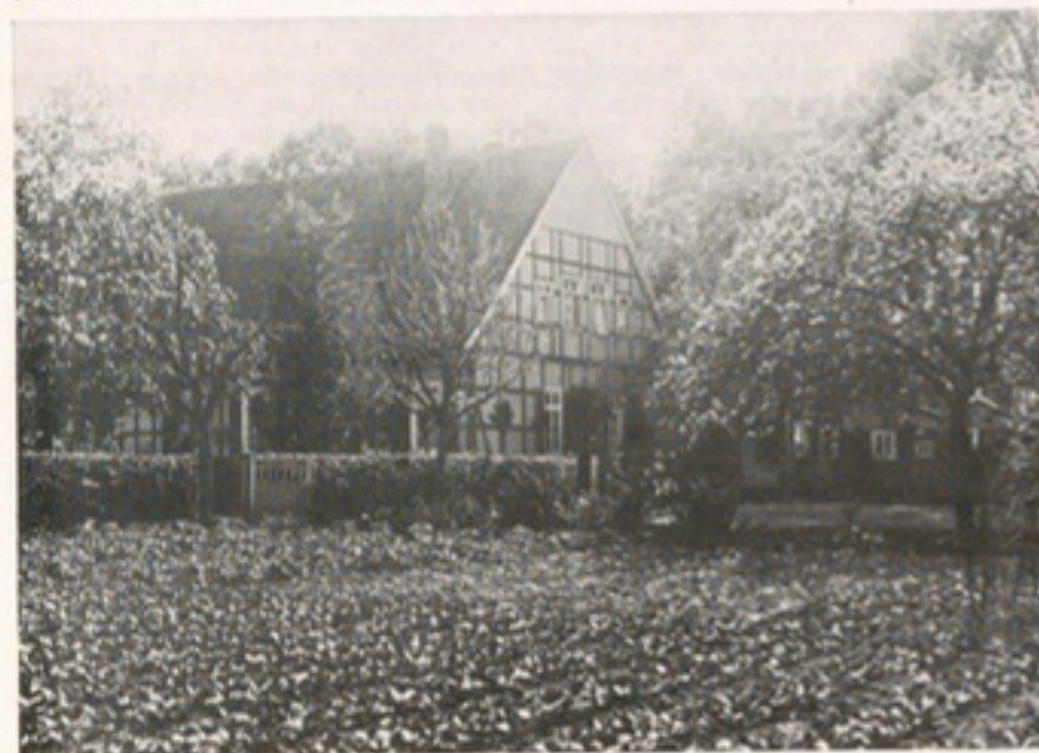
Das Kolonatshaus Jacobfeuerborn (Kattenstroth Nr. 5), der frühere Hof Schalück, um 1900