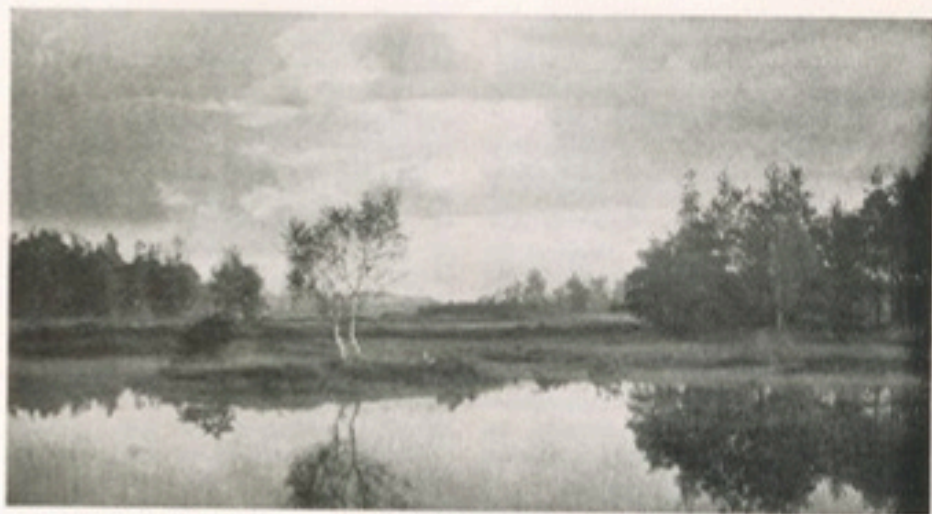
Die Bertels-Heide (aus W. Bartels: „Aus einer kleinen Heidestadt“, 1911)

deren Anblick einem wahrhaft das Herz warm wird! Auch der prächtige Bildband „Gütersloh, wie es war“ (bei Ludw. Flöttmann KG verlegt und von W. LENZ mit einer höchst willkommenen „Chronik“ versehen) bringt einige schöne Landschaftsbilder aus alter Zeit, die den eigenartigen Charakter der Umgebung unserer Heimat-