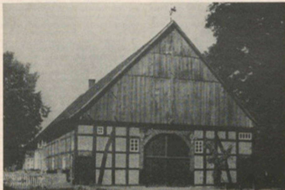
Der Erbhof Jacobfeuerborn gen. Hinnersmeier in Verl zu Anfang unseres Jahrhunderts

dem Glockenläuten erst dann zu beginnen, wenn er vom Turm aus an einer bestimmten Stelle der Landstraße das Schimmelgespann erblickte!