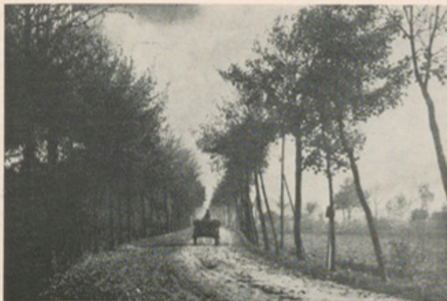
Die Verler Landstraße um 1910 (aus W. Bartels „Aus einer kleinen Heidestadt“)

des Hofes führende Reichsautobahn (1937/38) konnte ein moderner Um- bzw. Neubau des Wohnteils vorgenommen werden, den zu besichtigen ich noch keine Gelegenheit gefunden habe.