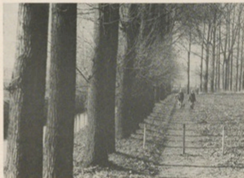
Am Wanderweg entlang der Lutter zwischen Isselhorst und Marienfeld

Burgruine Ravensberg Schwedenschanze am Teuto Schloß Holtfeld Schloß Tatenhausen Patthorst in Steinhagen Heidesee in Peckeloh Boomerbe in Harsewinkel Naturschutzgebiet Hühnermoor Niehorster Heide Rhedeer Forst Emstal und Furlbachtal Wasserschloß Holte Fischteiche in Rietberg