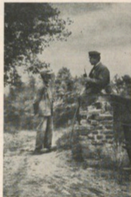
Idyll in der Süren-Heide (aus W. Bartels „Heidestadt“)

West- und Osteingang hatte an der Herdstelle (mit dem Rauchfang darüber) nicht mehr das offene Herdfeuer, sondern einen großen Küchenherd und neben dem Osteingang die Handpumpe, die ihr Wasser aus dem draußen gelegenen „Saut“ bezog, dazu die Wasch- und Kücheneinrichtung mit den notwendigen Gerätschaften. Diesem eigentlichen Küchenteil des Fleet gegenüber befand sich die zweite „Sietendüör“ und eine große Fensterwand aus Kleinfensterscheiben, vor der Wand ein großer Tisch, der im wesentlichen als Esstisch diente. Nebenan – im eigentlichen Wohnteil des Hauses – lag das „Wohnzimmer“, das durch einen großen Kastenofen von der Fleet aus beheizt werden konnte. Über den Wohnteil und sonstige Einrichtungen des Haupthauses oder der Nebenbauten hier ausführlicher zu berichten, muß ich mir versagen. Durch den beträchtlichen Erlös bei dem Verkauf der Grundstücke für die durch das Gelände