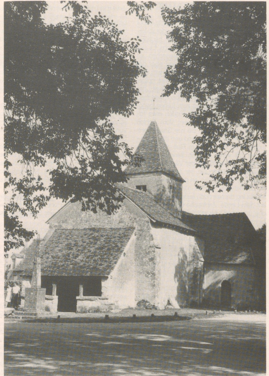
Die kleine Kirche von Nohant

Nach dem Tode der Herzogin fiel der gesamte Besitz wieder an die Krone zurück und wurde dem Grafen d'Artois übergeben, einem Bruder Ludwigs XVI., der 1776 die Provinzverwaltung des Berry schuf. An Stelle von Issoudun wurde Châteauroux nach der französischen Revolution dann Hauptstadt des Départments und erhielt die Beinamen Indre Ville (Stadt Indre) und Indre Libre (Freies Indre).