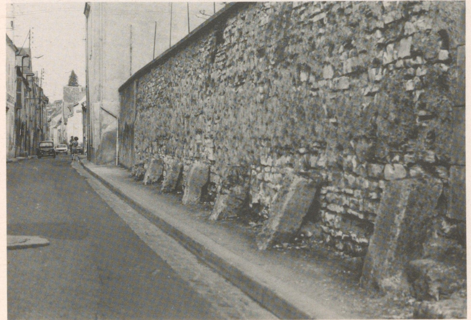
Ein Teil der alten Stadtmauer

Wie fast jede richtige Burg wurde natürlich das Château Raoul des öfteren belagert, erstmals im Jahre 1330 durch den schwar-