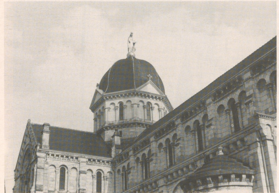
Die Kirche Nôtre Dame