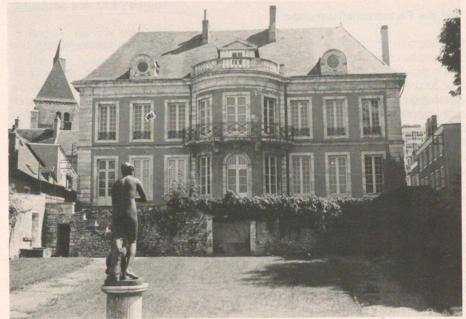
Das Haus Bertrand – seit 1925 Museum

So führten die Liebesaffären, wenn es überhaupt solche waren, zur Verbannung der Prinzessin von Condé nach Châteaurox.