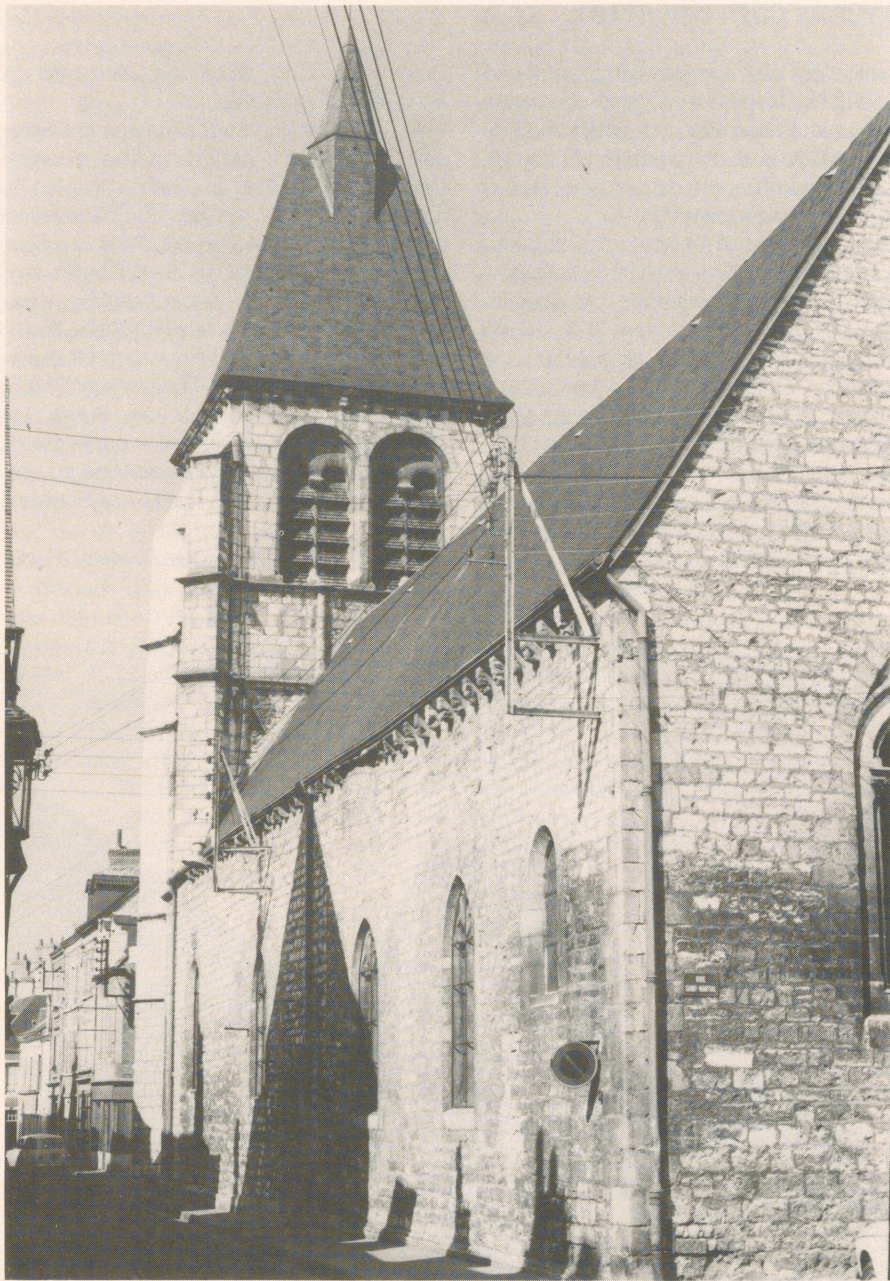
Die Kirche St. Martial