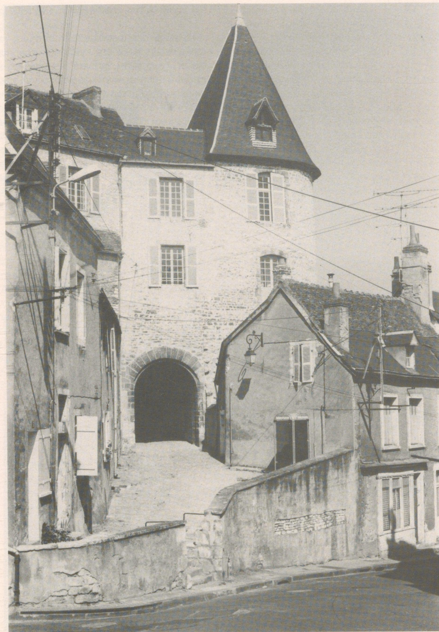
Das alte Gefängnistor

Ebbes besaß große Ländereien, ihm gehörte das ganze Bas Berry. Er war einer der er-