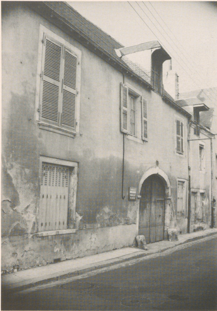
Das alte Châteauroux – Rue de l'Indre

sten, die Münzen prägten, und er führte ein eigenes Wappen.