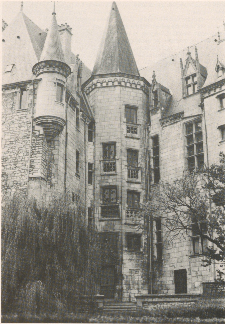
Château Raoul – markantes Wahrzeichen der Stadt