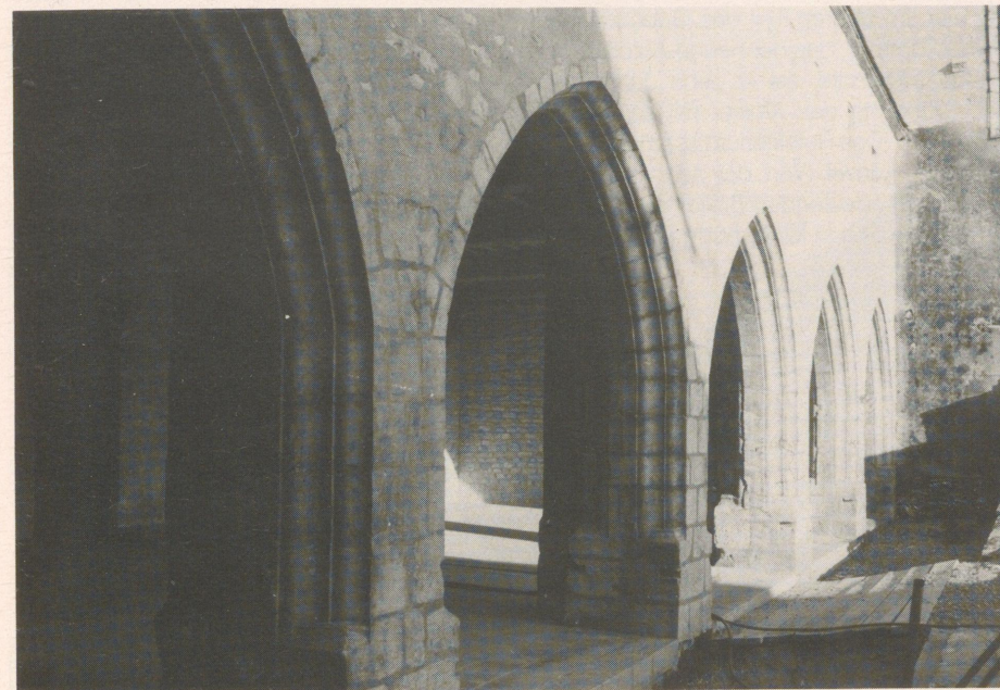
Les Cordeliers, Kreuzgang

Unter der Herrschaft derer von Chauvigny wurden die Kirchen Saint-Andre und Saint-Martin gegründet und das Kloster Les Cordeliers.