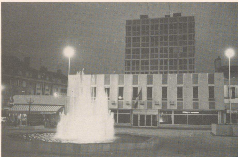
Hôtel de Ville – das Rathaus