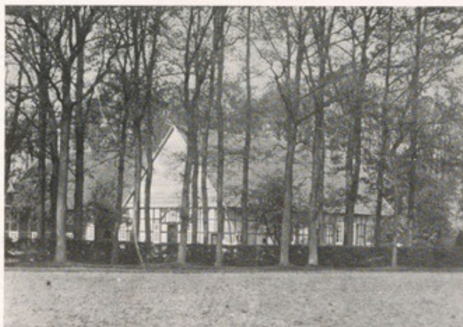
Das Kolonat Jacobfeuerborn (um 1925) vom Acker aus gesehen

Es mag noch erwähnt werden, daß im Hochsommer bei Feldarbeiten zur Durstlöschung mehrmals am Tage ein Eimer voll kalten Sautwassers bereitgestellt oder aufs Feld gebracht wurde (mit etwas Zucker und Essig und viel grobgebröckeltem Pumpernickel versehen). Nach längerem Durchziehen der Brot-