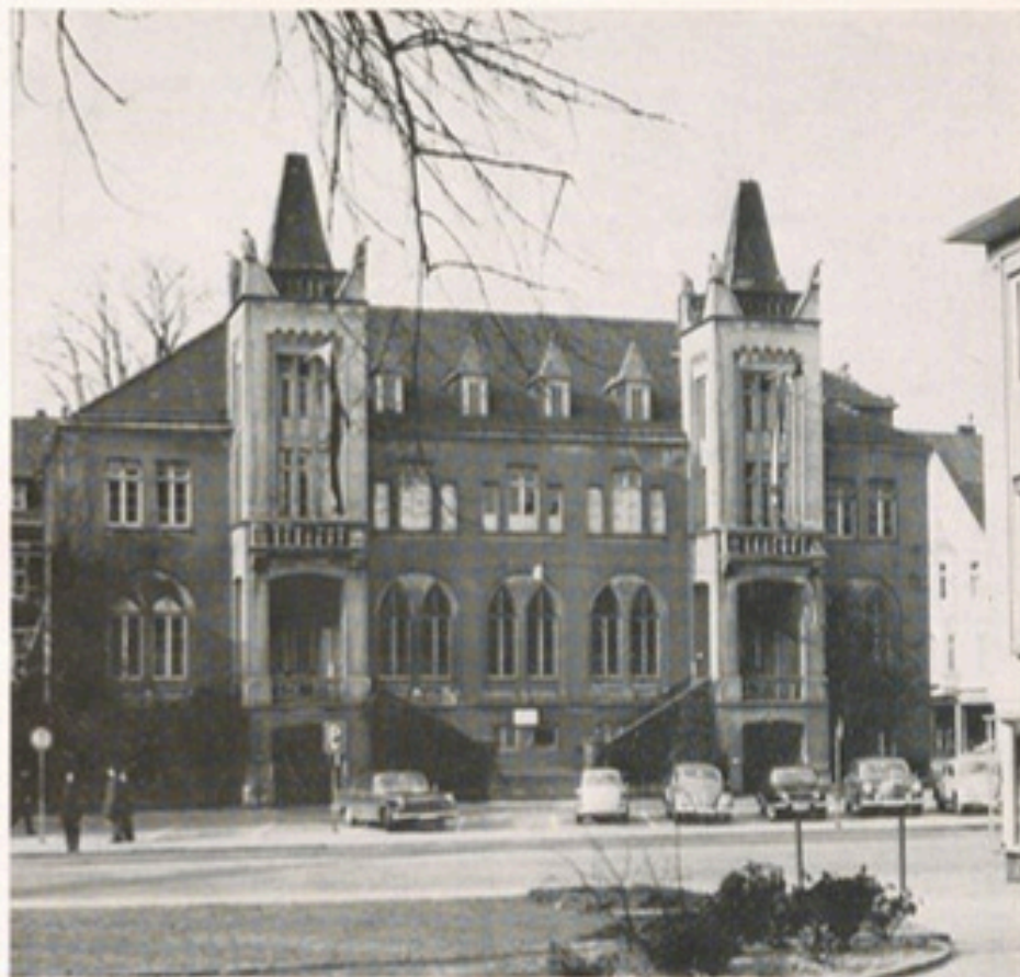
Das 1862 – 1864 erbaute und 1971 abgerissene alte Rathaus (Foto aus dem Jahre 1962)

Die Kirchengemeinde ließ am 4. 7. 1936 die finanzielle Lage der Krankenhäuser durch einen Fachmann überprüfen. Durch die Überprüfung wurde die Notlage zwar festgestellt, aber nicht gebessert. Zudem waren bauliche Schäden an den Häusern, vor allem am neuen Haus, eingetreten, die behoben werden mußten. Geld stand hierfür nicht zur Verfügung. Ein nachgesuchter Kredit wurde versagt. Am 23. 9. 1937 beschloß der Verwaltungsrat der Barth'schen Stiftung, die Krankenhäuser der ev. Kirche anzubieten und die Stiftung aufzulösen.