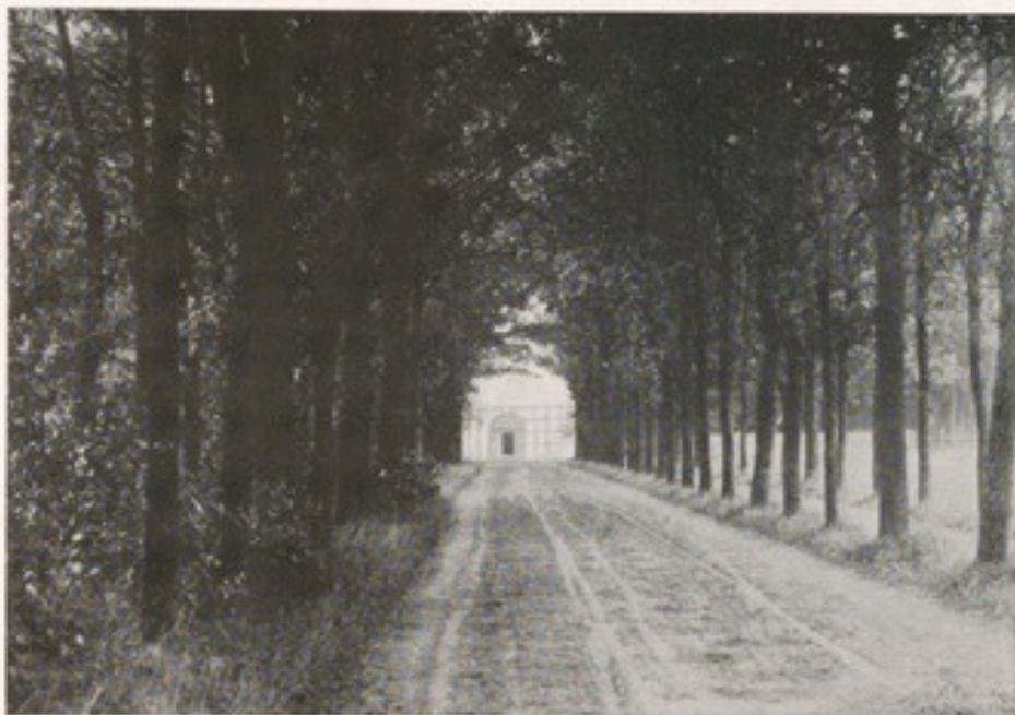
Die Eichenallee mit Blick auf die Südfront des Wohnhauses (um 1920)

Von den Früchten des Gartens wie Spargel, Erdbeeren, Johannis- und Stachelbeeren, auch Edelobst, wurde das meiste oder viel verkauft, natürlich auch Butter, Milch und Eier. Dann und wann wurde ein Huhn geschlachtet. Hasen, Fasanen und Feldhühner, die Vater als guter Jäger von der Jagd mitbrachte, wurden meist verkauft, wilde Kaninchen wurden an Rüschkamp oder Pähler verschenkt. Für einen guten Hasen, den ich in die Kökerstraße brachte, gab es damals einen Taler.