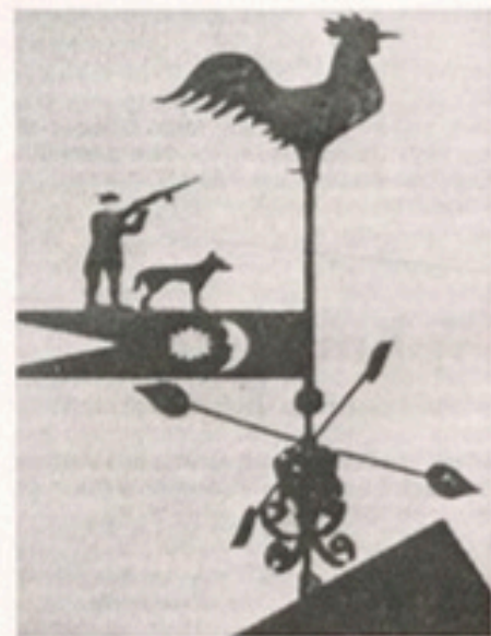
Wetterhahn und Wetterfahne (mit Jäger und Hund) auf dem Feuerbornschen Hof

Aber nun bitte ich meine verehrten Leser, sich einmal im Geiste auf den damaligen Hof oder in den Garten hineinzusetzen-