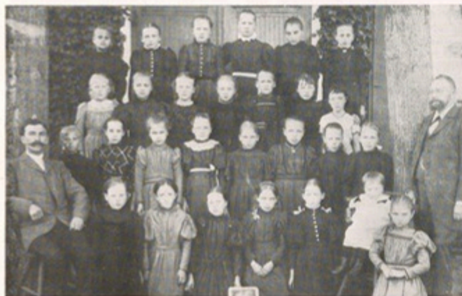
links Lehrer Koke