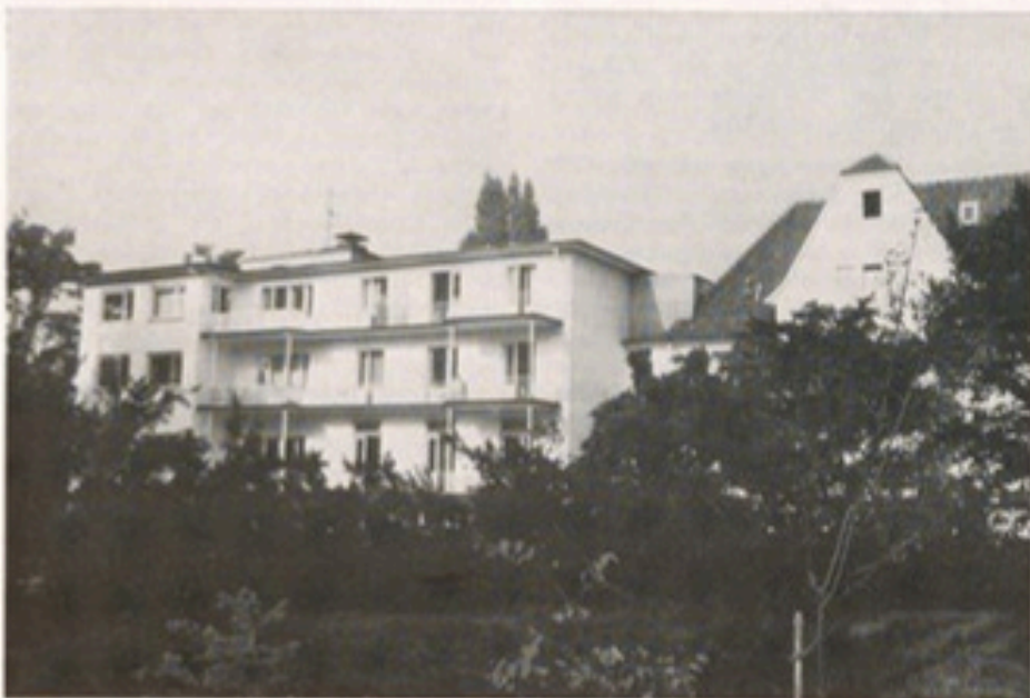
Die Privatklinik Dr. Murken im Sommer 1973 von der Gartenseite aus

Inzwischen besteht die von Diedrich Murken gegründete Klinik im 28. Jahr; sechs Belegärzte sind auf drei Abteilungen tätig, ein großes Schwesternwohnheim wurde (1971–1972) errichtet, und die Zahl der Verpflegungstage ist weiter angestiegen. In den nächsten Jahren werden neue Planungen, Einrichtungen und Erweiterungen notwendig werden, damit sich die Klinik im Sinne des Gründers auch zukünftig ständig dem medizinischen Wandel der Zeit anpassen und fortentwickeln kann.