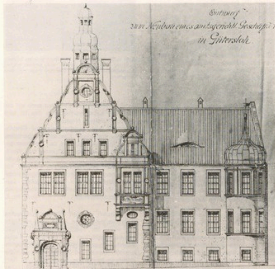
Abb. 2: Entwurf für die Hauptfassade des Gütersloher Amtsgerichts (Städt. Bauamt Gütersloh)