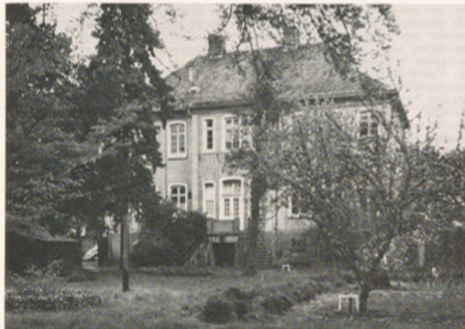
Würde der so viel diskutierte Rhedaer Bebauungsplan „Ost-Tangente“ voll realisiert werden, wären diese Fotos historische Dokumente.

Straßen, die nun einmal nicht asphaltiert sind – ein Stückchen Kiefernwald mitten in der Stadt – Winkel, Schuppen, Lauben – wenn sie von alle dem möglichst viel hat, dann ist sie gegen alle Widerrede EIN GLÜCKLICHER ORT, den man hüten