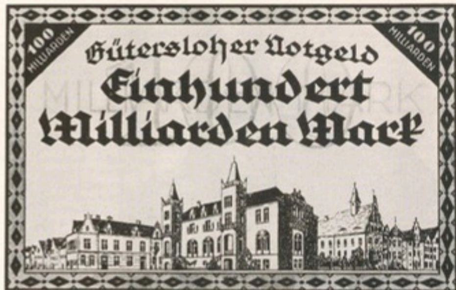
Abb. 5: Die Darstellung des alten Amtsgerichts (rechts) und des Alten Rathauses (Mitte) auf einem Gütersloher Notgeldschein aus dem Jahre 1923

Mit dem neuen Amtsgericht entstand ein eindrucksvolles Kulturdenkmal, das bis heute dem allgemeinen Schicksal wertvoller bauhistorischer Bauten in Gütersloh, dem Abbruch, durch glückliche Umstände entging. Gerade dieses Gebäude ist das letzte hervorragende Baudenkmal des Wilhelminischen Zeitalters, das wir in Gütersloh finden können. Mit diesem Bau konnte der Baumeister einen deutsch-nationalen Baustil anhand traditionsreicher Vorbilder weiterentwickeln, ohne in eine Nachahmung zu verfallen. Gleichzeitig schuf er für die Justizbehörde einen repräsentativen Baukomplex, der durch seine freundliche, harmonische Architektursprache den Bürger nicht abschreckte.