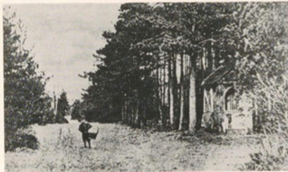
Der im Jahre 1715 errichtete Bildstock an der Kreuzung der Schledebrückstraße mit dem alten und heutigen „Heilweg“; oben auf S. 29 in Hermann Eickhoffs „Geschichte der Stadt und Gemeinde Gütersloh“ aus dem Jahre 1903/04 als „Landschaft in der Umgebung von Gütersloh“ abgebildet, unten auf einem Foto von Paul Westerfröke aus dem Jahre 1974.

Es mag noch der Erwähnung wert sein, daß zu meiner Zeit die Fortsetzung des Brockwegs über die Ölbachbrücke auf sandigen Heidewegen, an Kiefernwäldchen und wenigen Gehölften vorbei, bei „Jans inne Fichten“ endete, der Gastwirtschaft „Jägerheim“ an der Landstraße Wiedenbrück-Rietberg. Das war damals ein beliebter Treffpunkt von „Studenten“ der genannten Städtchen, und auch unser Freundeskreis am Gütersloher Gymnasium wanderte manchmal dorthin, wo der gemütvolle Wirt, Johannes Brentrup, im