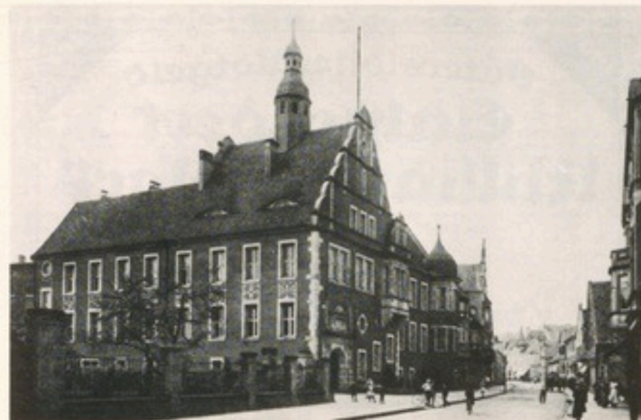
Abb. 4: Ansicht des alten Amtsgerichts von der Ecke Berliner Straße/Königstraße (aus „Deutschlands Städtebau“, Berlin 1925, S. 53)

Die nach Osten ausgerichtete Front des Hauses wurde einfacher durchkomponiert, ähnlich wie wir es auch bei den Seitenfassaden der Renaissancebauten längs der Weser finden. Durch die klare Aufteilung der rechteckigen, mit Sandstein eingefassten Fenster des ersten und zweiten Geschosses – nur in der äußersten Achse wird für das dahinter befindliche Treppenhaus ein Fenster auf die Höhe des Zwischengeschosses verschoben – strahlt der Baukörper im Gegensatz zu der dynamischen Giebelfront eine beruhigende Wirkung aus (Abb. 3). Bemerkenswert ist die dekorative Felderung zwischen den beiden Fenstergeschossen, die eine variationsreiche Ornamentik zeigen. Diese Längsfront leitet zum viergeschossigen Gefängnisstrakt über, der im spitzen Winkel angefügt wurde. In seiner vorderen Front paßte sich dieser Anbau mit seinem Flachdach unauffällig der Architektur des Seitenflügels an. Die innere Raumaufteilung des Gebäudes entsprach dem damals üblichen Schema für ein preußisch-deutsches Amtsgericht. Unmittelbar nach dem Eintritt führte eine breite zweiläufige Treppe den Besucher zum Hauptgeschoß, wo auf der Südostseite des Hauses an einem seitlich verlaufenden Flur das Zimmer des Richters, die Registratur, die Schreibstube, das Archiv und ein Zimmer für den Anwalt lagen. Rechts vom Mittelflur befanden sich im kürzeren Nordflügel je ein Dienstzimmer für den Gerichtsdiensten und den Amtsanwalt, dahinter richtete man den Kassenraum ein.