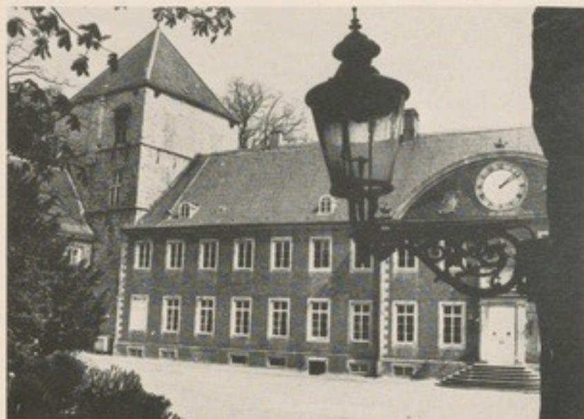
Schloß Rheda – baugeschichtliches Dokument von der Romanik bis zur Gotik