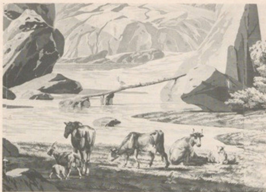
Oben ein Ausschnitt aus dem Mittelteil der unteren Landschaftstapete