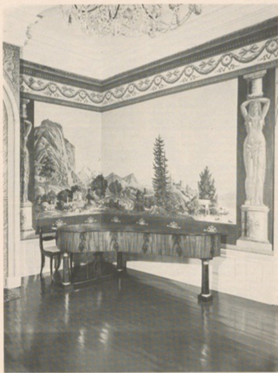
Auf dieser Schweizer Landschaftstapete ist links am Berghang der berühmte Staubbach-Wasserfall im Lauterbrunnental zu sehen; am rechten Bildrand eine der im Text beschriebenen Karyatiden

Eine weitere Besonderheit kam durch die Umrandung hinzu: Acht annähernd lebensgroße Frauengestalten aus Tapete bilden für Landschaft und Türen die majestätische Rahmung. Sie täuschen Säulenfiguren