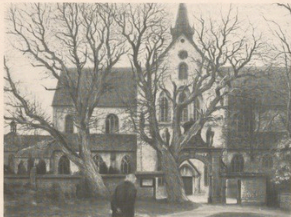
Die Klosterkirche Marienfeld, im Vordergrund der damals amtierende Pastor Mellage

Eines seiner bekanntesten Bilder, die Klosterkirche Marienfeld mit dem damals amtierenden Pastor Mellage im Vordergrund, befindet sich im Westfälischen Landesmuseum für Kunst- und Kulturgeschichte in Münster.