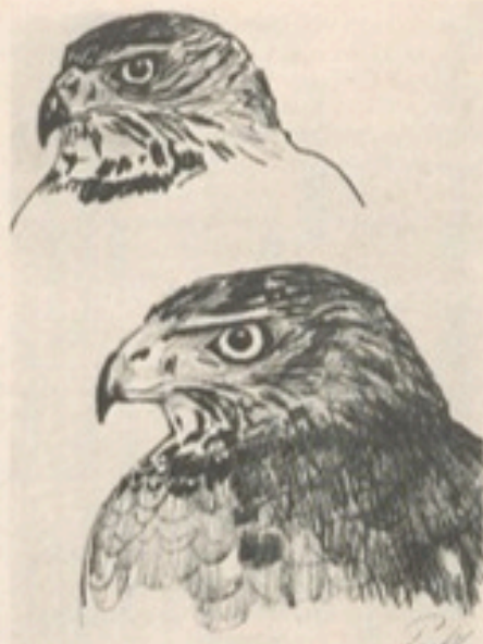
Von Westerfröke gezeichnete „Habichtsköpfe“

Oder Tagebuch 1950, S. 42 ff.: „8. 4. Um 18 Uhr sehe ich in der Gegend des Schwarzen Grabens (Rietberger Fischteiche; Anm. P.) einen Fischadler auf Weidepfahl fliegen. Er hat eine Beute, wahrscheinlich Fisch, denn er kam niedrig herauf von einem Teich. Auf dem Pfahl, der die übrigen an Länge überragt, schüttelt er sich, äugt und beginnt zu kröpfen. Nach jedem Abreißen eines Bissens wendet er nach den Seiten halb nach oben den Kopf. Er scheint jeden vorbeifliegenden größeren Vogel, Brachvogel, Tauben, Turmfalk, Kiebitz, mißtrauisch kurz zu mustern. Eine knappe Viertelstunde dauert das Kröpfen. Eine Frau, die auf etwa 60-80 Meter an ihm vorbei durch die Wiesen geht, beachtet er nicht. Ein Kiebitz läßt sich nur etwa 10 Meter von ihm nieder. Nach der Mahlzeit sitzt er in ziemlich gerader Haltung, schüttelt wohl mal schwerfällig die Flügel, löst sich, äugt umher, beachtet auch