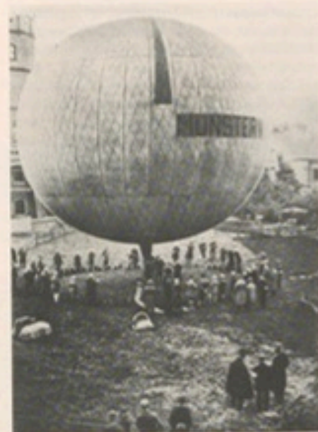
Ballonaufstieg der „Münsterland“ neben dem Wasserturm (am linken Bildrand)

Wer einmal angefangen hat, Ordnung in alte Bilder zu bringen, will ja nicht nur chronologisch sortieren, sondern ein Erinnerungsgebäude rekonstruieren, und da stößt er bald an Grenzen. Vieles fehlt, und Vorhandenes ist schwer zu identifizieren. Wer sind die 39 Quintaner von 1926 „bei der Schlacht am Gaurisankar“, mit Pfeil und Bogen, mit den Kindergesichtern und mit Lateinmagister Keilner? Oft martert man das müde Hirn vergeblich. Doch der alte Schüler, vom Bazillus der Perfektion infi-