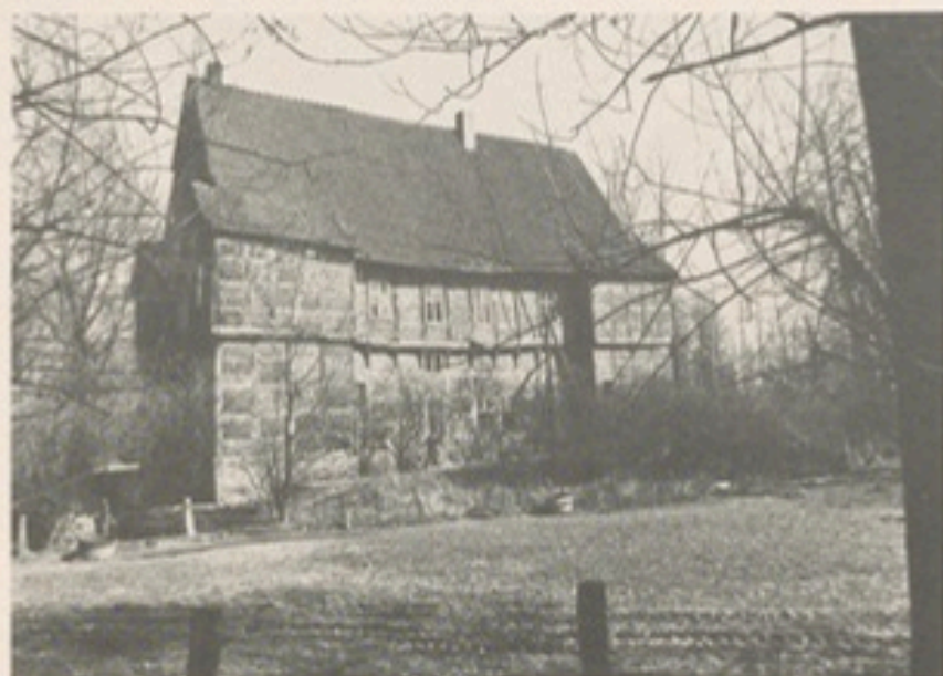
Haus Aussenl – 400 Jahre alter Burgmannshof in Batenhorst