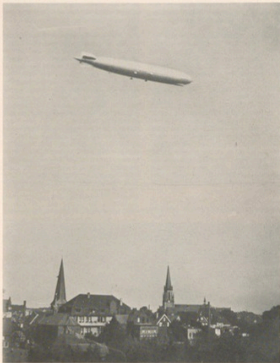
Das Luftschiff „Graf Zeppelin“ über den Dächern der Stadt Gütersloh

und Kleben der vielen Profilrippen für den Flügel hing es ab, wie sicher und wie lange die angehenden Segelflieger später in Oerlinghausen ihre ersten Hopsier würden machen können. So übten sich die Hinterbänkler nach der Schule in handwerklicher Gewissenhaftigkeit, sicher nicht zum Schaden für ihre künftige Arbeitsmoral. Und sicher mit mehr Spaß als beim Vokabelbüffeln.