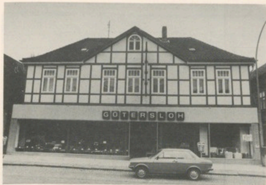
Straßenansicht des Möbelhauses „Gütersloh“ an der Neuen Straße in Bremervörde.

Die Kenntnisse über seine Vorfahren waren leider sehr gering und da er das gleiche von den anderen Bremervörder Familien annahm, haben wir auf weitere Besuche verzichtet und sind dann zum Hauptziel unserer Studienfahrt aufgebrochen.