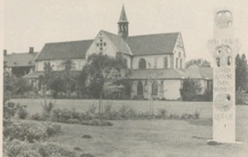
Die Abteikirche des 1185 gegründeten Zisterzienserklosters Marienfeld.

Ob man dies ohne weiteres auf die westfälischen Verhältnisse des Früh- und Hochmittelalters übertragen darf, ist nicht sicher. Man wird aber wohl nicht sehr fehlgehen, wenn man für loh in Gütersloh in etwa die Bedeutung „schütterer Wald, vielleicht auch Niederwald, der zur Weide genutzt werden konnte“, ansetzt.