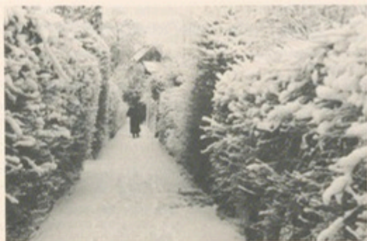
An Alt-Gütersloh erinnert auch dieses Foto aus dem Dezember 1940 vom verschneiten „Judenpötkchen“, das von der Königstraße zur Synagoge an der heutigen Datsopstraße führte.